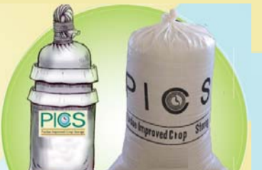
विना बिपारी बीउ तथा बाधान, सुरक्षित भण्डारणको लागि PICS Bag Hermetic Storage