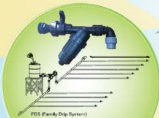
FDS (Family Drip System) कम लागतमा धेरै उत्पादन गर्न थोपा सिंचाई NETAFIM Drip Irrigation