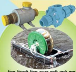
विना बिजुली विना इन्धन पानी तान्ने पम्प Zero Energy Pump