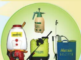
सबै किसिमका हाते पम्पहरू Sprayers