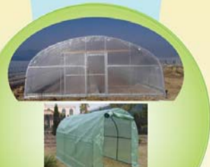
आधुनिक प्रविधिको ग्रीन हाउस Green House