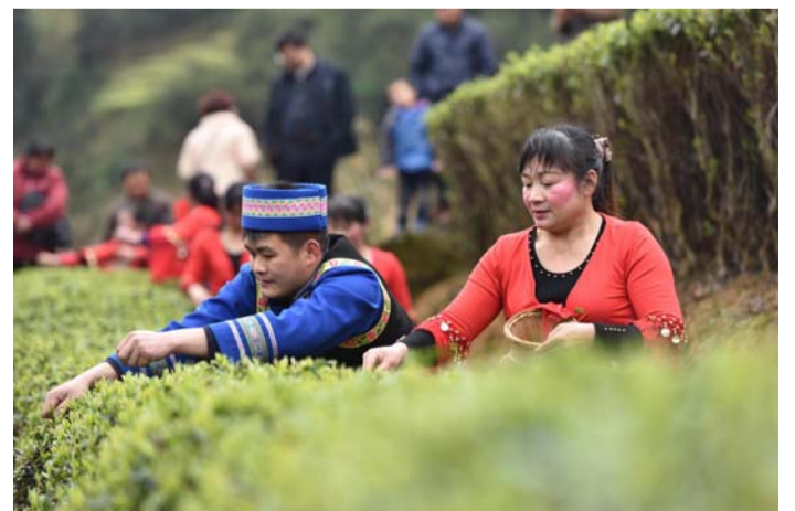
चीनको एक चिया बगानमा चिया पत्ति टिप्दै चिनिया किसानहरु